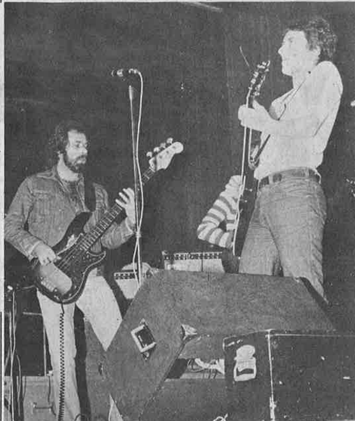
Festivalens stora dragplåster var givetvis Ulf Lundell och Nature. Ulf (t.h. på bilden) möttes av stort jubel från de drygt 1.400 åhörarna när han gjorde entré.